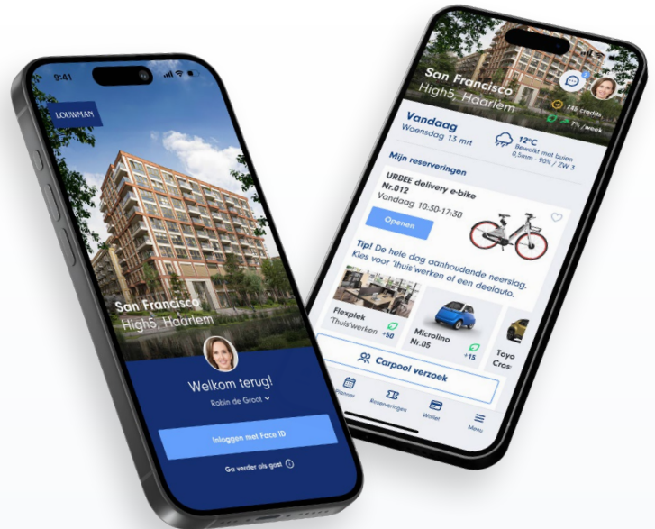
Login & Home

Wat betreft de implementatie van ons mobiliteitsconcept: we streven ernaar dit zo snel mogelijk te realiseren. We houden je op de hoogte van de voortgang en kijken uit naar een toekomst waarin duurzame mobiliteit voor iedereen toegankelijk is.